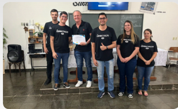
Projeto Luminar formandos da ETEC reformaram uma sala no Raio de Luz e a JB foi uma das parceiras.