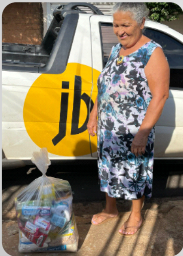
Doação de Cesta Básica Projeto Colaboradores JB