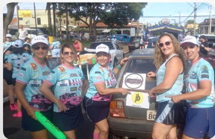
Participação no Rally do Batom homenagem ao dia internacional da mulher