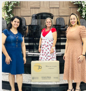
Entrega de Produto JB igreja Assembleia de Deus em Votuporanga