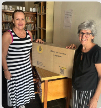
Doação de Produto JB Raio de Luz - chá beneficente.