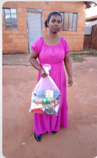
Doação de cesta básica e um produto JB Projeto Colaboradores JB