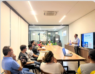
Implantação do 8s