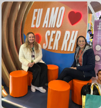
Congresso nacional dos Recursos Humanos-SP