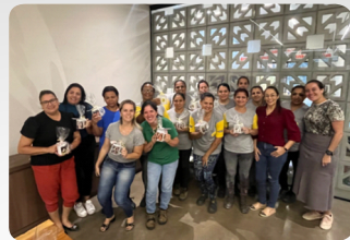
Dia das Mães café da manhã para todas as mães da JB