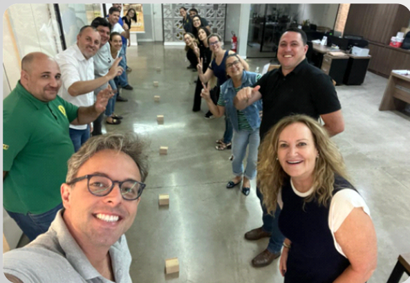
Dinâmica Em equipe