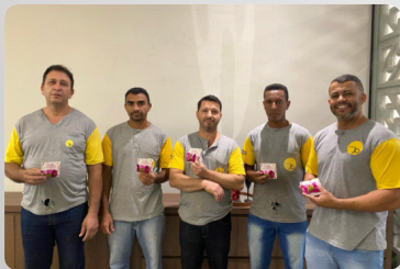
Doação de Sangue Colaboradores da JB Móveis