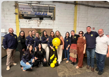
103 anos Família Bechara