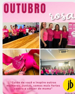
Campanha Outubro Rosa