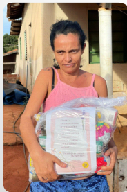
Doação de Cesta Básica Projeto Colaboradores JB