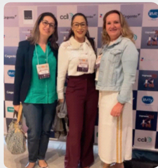
Palestra Amor corporativo