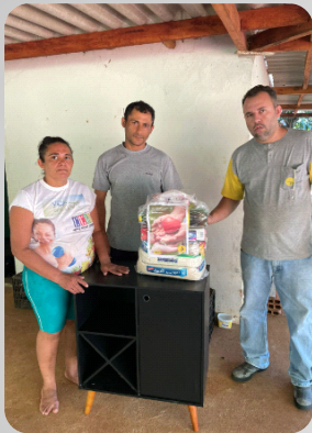
Doação de cesta básica e um produto JB Projeto Colaboradores JB